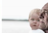
Des idées pour passer du temps d... ougashell.com