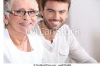
Femme aînée, jeune homme, séa...