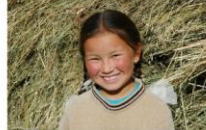
Kirghizistan : portraits d'enfants: S... syvliasserre.blogspot.com