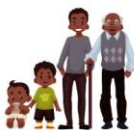
Übungen - L'être hum... anton.app