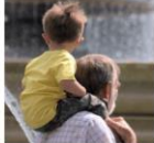
Partage intergénération... pilotto.fr